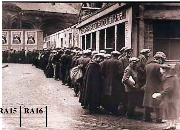
La queue à la soupe populaire dans les années 1930 à Paris